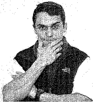
Pier Giorgio Bellocchio

ma soprattutto con un incremento degli incontri con registi ed interpreti, vero fulcro della manifestazione, che supereranno quota 50 nei prossimi due mesi. Tra gli ospiti attesi in regione per la rassegna figurano Emidio Greco (il 14, 15 e 16 giugno a Modena, Rimini e Parma), Remo Girone (il 22 e il 23 giugno a Parma e Bagnacavallo), Aureliano Amadei (il 27 e 28 giugno a Bologna e Carpi), Pier Giorgio Bellocchio (l'11 e il 12 luglio a Bologna e Carpi), Massimiliano Bruno (l'8 luglio a Casalecchio), Antonio Capuano (il 19 luglio a Forlì), Giorgia Cecere (il 26, 27 e 28 giugno a Reggio Emilia, Parma e Rimini), Claudio Cupellini (il 30 giugno a Bologna), Daniele Gaglianone (il 7 e l'8 luglio a Parma e Bagnacavallo).